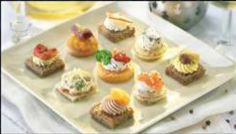
72795 / Plateau Salé Tradition x 54