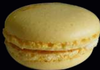
72493/ CREME CITRON