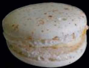
• 72498/ CHEVRE PIMENT D'ESPELETTE