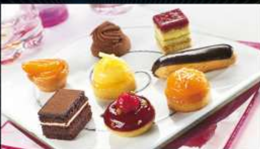
72785/ Petits Fours Sucré Tradition x 48