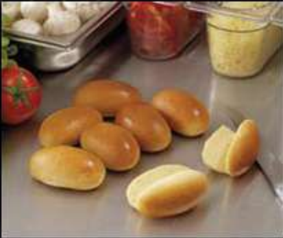
720183 / Mini navettes nature allongées 15 gr X 50