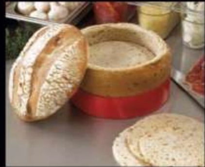
72673 / Pain Surprise 6 Céréales à Garnir 10 disques ø 20cm, 450gr, C/2