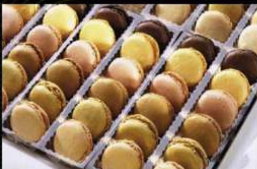
72351 / Macarons découverte symphonie X 72