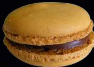
72735/ CAMEL BEURRE SALE