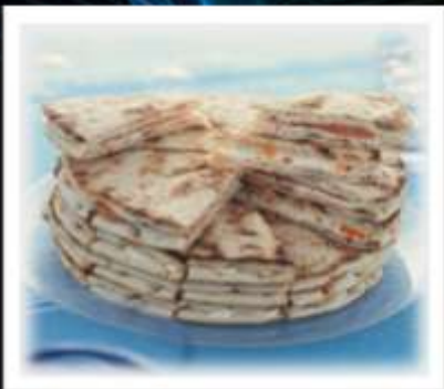
72344 / Pain Nordique du Voyage, 40 pièces