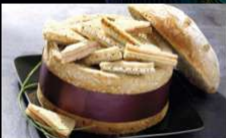
72674 / Pain Surprise 6 Céréales x 50