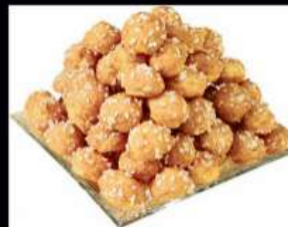
72319 / Mini chouquettes Pasquier 14g X 486