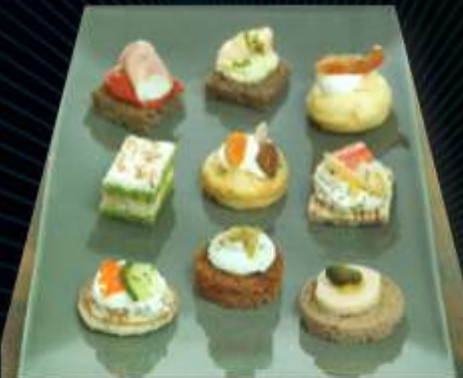
72945 / Plateau Salé Prestige x 54