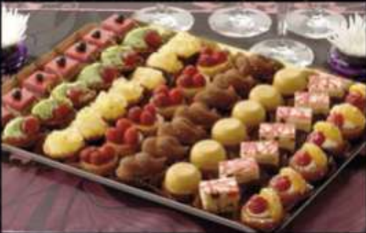
72737 / Petits fours sucrés Deauville X 52