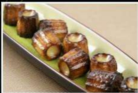
72731 / Canelé « bouchée » bordelais cuit 17gr x 150