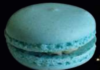
72985/ MENTHE GLACIALE