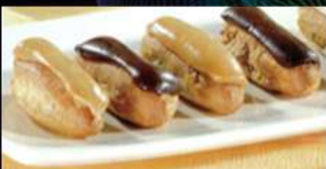
720177/ Minis Eclairs Ass. Plateau x 22