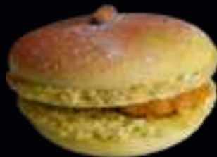
• 72495/ TOMATE BASILIC