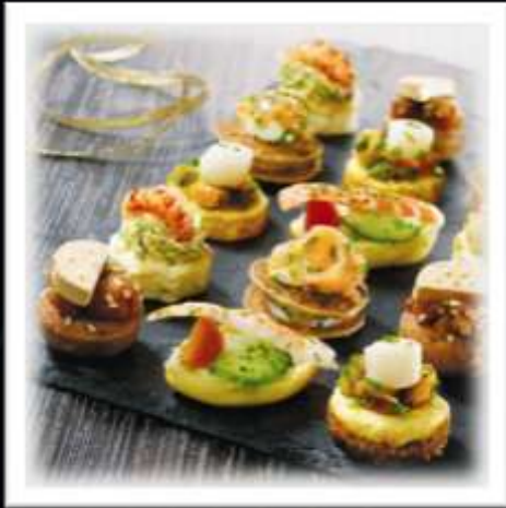
72307 / Plateau Découverte Gourmandes, 35 pièces