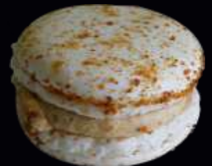
72496/ PAIN D'EPICES