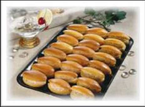
72296 / Minis Navettes garnies assorties, 24 pièces