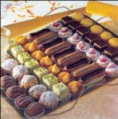
72739 / Petits fours sucrés X53