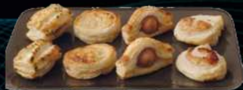
72321 / Petits Fours Apéritifs assortis, 5kg

Saumon, Jambon/Fromage, Pizza, Saucisse Cocktail