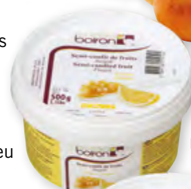
Semi-confit de citron Pot de 500 g Code BEF S30150