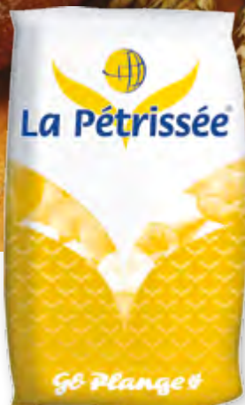
Préparation de panification, LA PÉTRISSÉE® Sac de 25 kg Code BEF 009472