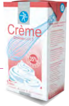
Crème stérilisée UHT 35% MG Brique de 1 L Code BEF 028235