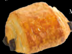
Mini-Pain au chocolat 30 g Code S29861