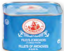
Filets d'anchois allongés à l'huile d'olive Boîte 4/4 Alu Tir-Hop « La Monégasque » Code BEF 004878