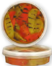
Poivrons pelés grillés à l'huile 1 kg Code BEF 023417