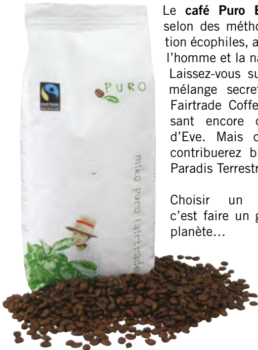
Café moulu bio Paquet 250 g Code BEF 028356