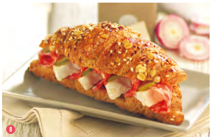
❼ Feuilleté Hot-Dog

L'idéal pour booster les idées et les ventes.