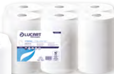
Jumbo Strong L-One Mini 180 Carton de 12 pièces Code BEF 029560