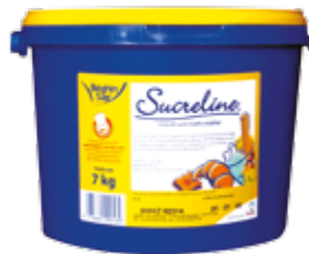
Seau de 7 kg