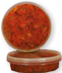
Tomates confites à l'huile 1 kg Code BEF 022818

« Pour agrémenter vos salades, vos pizzas et vos sandwichs »