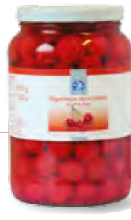
Bigarreaux dénoyautés Bocal de 2 L Code BEF 014764