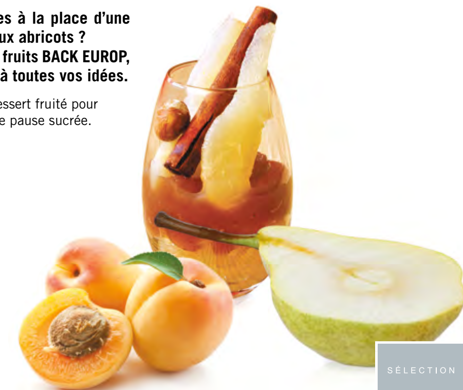
Demi-poires Williams au sirop léger Boîte 3/1 Code BEF 006327