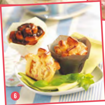
❹ Triangle Bretzel