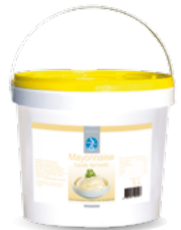
Mayonnaise Haute Fermeté Seau de 5 L Code BEF 020801