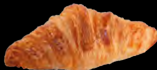
Mini-Croissant 25 g Code S29860