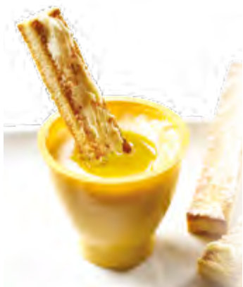
Œuf cuit façon coque Code BEF en cours de création