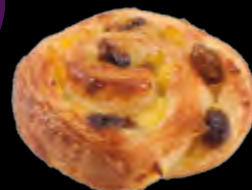
Mini-Pain aux raisins 35 g Code S29859