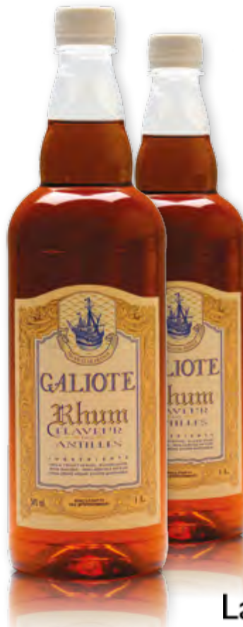
Rhum faveur des Antilles 54% vol. Bouteille 1 L Code BEF 012246