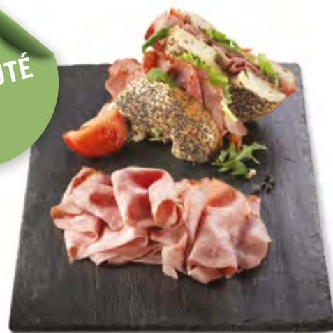
Pastrami de bœuf Barquette de 20 tranches Code BEF 028276