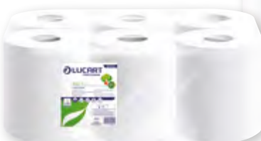
Bobine dévidage central 450s Carton 6 recharges Code BEF 018995