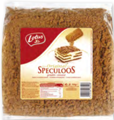
Original speculoos Lotus concassé Sachet 750 g Code BEF 024813