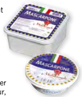
Mascarpone Barquette 2 kg Code BEF 025828

Laissez libre cours à votre créativité en composant mousses, crème, tous types de sauces et autres recettes chaudes ou froides, salées ou sucrées, les plus audacieuses.