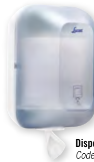
Dispenser L-One Maxi Code BEF 029555