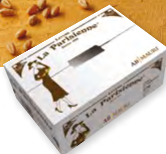
Levure de panification, LA PARISIENNE Carton de 10 kg Code BEF 009309