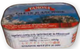
Filets d'anchois allongés à l'huile végétale Boîte 4/4 Alu Tir-Hop « Famosa » Code BEF 005193

« Pour des pizzas et des pissaladières réussies »