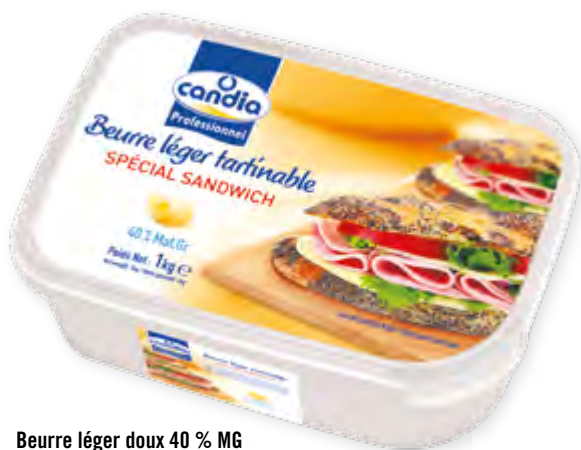
Beurre léger doux 40 % MG Barquette 1 kg Code BEF 029864