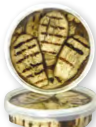
Aubergines grillées à l'huile 1 kg Code BEF 023418

« Pour des pizzas et des pissaladières réussies »