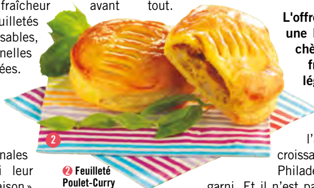
2 Feuilleté Poulet-Curry

L'offre de Feuilletés traiteur se décline en une large palette de garnitures : épinard-chèvre, poulet-curry, champignon-bœuf, fromage, Hot dog ou encore porc & légumes à l'indienne.