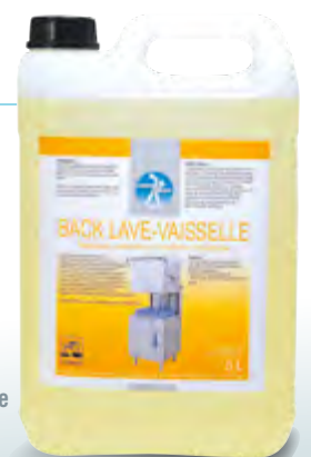
Back Lave-Vaisselle Bidon de 5 L Code BEF 016767