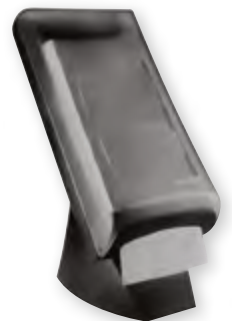
Dispenser L-One Tabletop Code BEF 029561