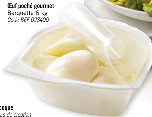
Œuf poché gourmet Barquette 6 kg Code BEF 028400