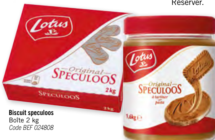
Biscuit speculoos Boîte 2 kg Code BEF 024808