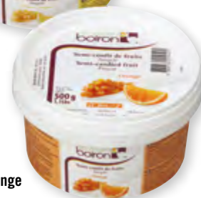
Semi-confit d'orange Pot de 500 g Code BEF S30151

Recette : Pain de Gênes et marmelade d'orange pour 50 petits gâteaux individuels. Création Ollivier Christien, Chef Pâtissier.