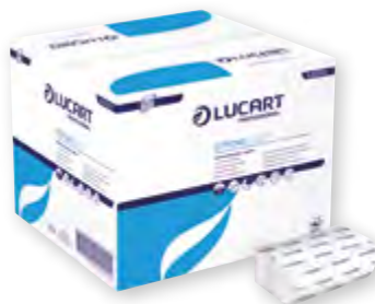
Serviet Strong L-0 White 216X40 Code BEF 029564

Les produits L-One vous permettent une meilleure maîtrise de la consommation grâce à leurs systèmes de distribution feuille à feuille.